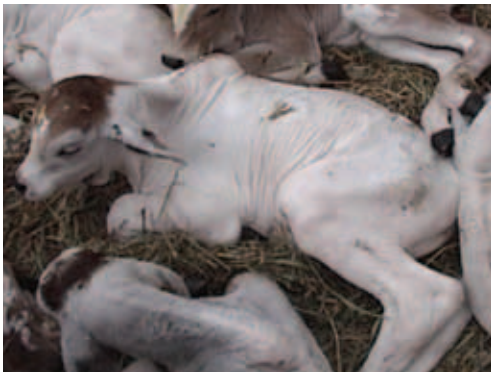
BEZERROS EM BOAS CONDIÇÕES, INDICATIVO DE VIGOR ADEQUADO