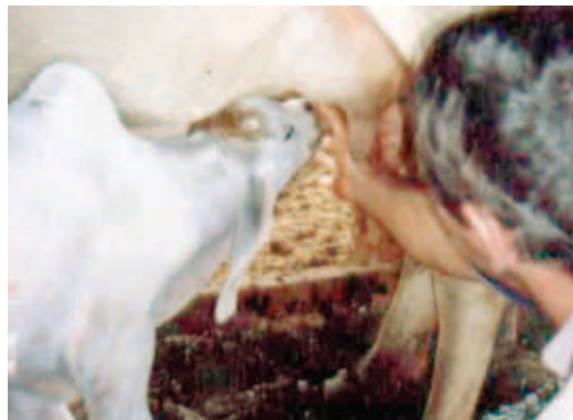
AUXÍLIO PARA MAMAR