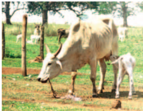
VACA COMENDO PLACENTA

Vacas muito gordas ou muito magras apresentam maior risco de problemas de parto; as gordas por apresentarem contrações mais fracas e as magras podem não terem a energia necessária para o trabalho de parto.