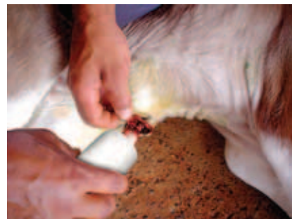
ASSEPSIA DO UMBIGO

É recomendado pesar os bezerros no dia seguinte ao nascimento. O ideal é usar balanças portáteis para que possam ser levadas ao pasto-maternidade. Caso não haja disponibilidade de balança na fazenda pode-se avaliar o peso dos bezerros considerando três categorias: leve, médio e pesado.