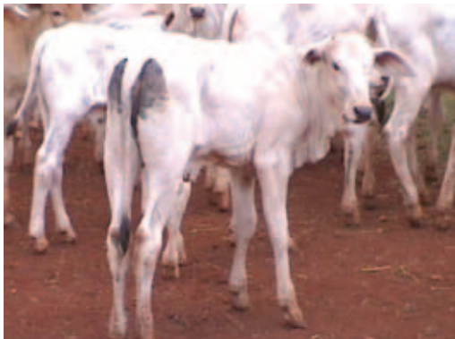
BEZERRO COM DIARREIA

A par dessas informações, buscamos os motivos para tais perdas, que ocorrem principalmente quando há dificuldades no parto, baixo vigor dos bezerros e cuidados maternos deficientes. Estes problemas são mais comuns quando os bezerros são muito pequenos ou muito grandes. Há ainda a possibilidade de ocorrer acidentes com os bezerros, que podem ser minimizados evitando-se situações que colocam suas vidas em risco. Por exemplo, devemos evitar pastos maternidades pequenos, com alta densidade, com buracos e com curvas de nível profundas, que acumulem água.