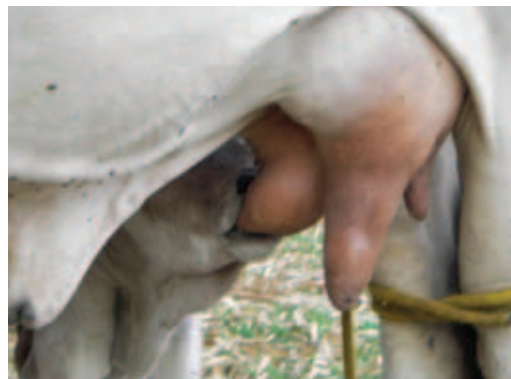
AJUDANDO O BEZERRO A MAMAR