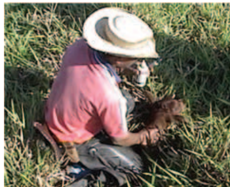
CUIDANDO DO BEZERRO NO LOCAL DO NASCIMENTO