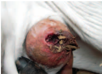
UMBIGO COM BICHEIRA

Em casos específicos, como os de bezerros com umbigos inflamados e bezerros muito fracos, pode ser aconselhável a utilização de antibióticos, que devem ser recomendados pelo veterinário responsável.