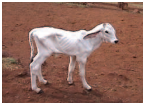
BEZERRO COM O VAZIO FUNDO, INDICATIVO DE FALHA NA PRIMEIRA MAMADA