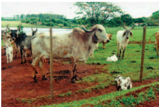
BEZERRO DO OUTRO LADO DA CERCA

Os estímulos externos podem prejudicar o reconhecimento entre mãe e filhote. Sabemos que em áreas com muito movimento as vacas geralmente interrompem o contato com o bezerro, deixando de cuidar da cria para ficar em vigilância. Com isto, há um aumento no tempo que os bezerros levam para se levantar e mamar.