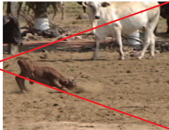
EVITE MANEJAR OS BEZERROS DE FORMA AGRESSIVA

Outro vaqueiro deve permanecer atento, não permitindo a aproximação da vaca em direção ao companheiro, até que ele esteja sobre o cavalo novamente.