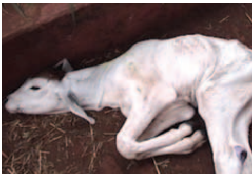
BEZERRO PROSTRADO, INDICATIVO DE BAIXO VIGOR