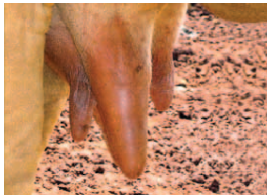
TETO NÃO MAMADO

Nos casos em que ocorrer abandono ou troca de bezerros deve-se aproximar a mãe de seu filho, mantendo-os juntos em local tranquilo para que possam formar os laços materno-filiais.