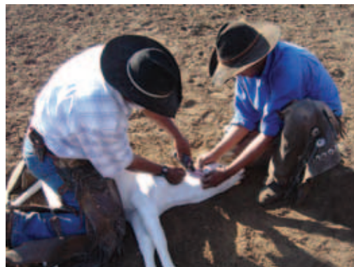
BEZERRO CONTIDO COM EFICIÊNCIA

Não jogue o bezerro no chão , levante-o um pouco do solo e utilize sua perna como apoio para descê-lo ao chão. A contenção para manter o bezerro deitado deve ser feita sem força exagerada.